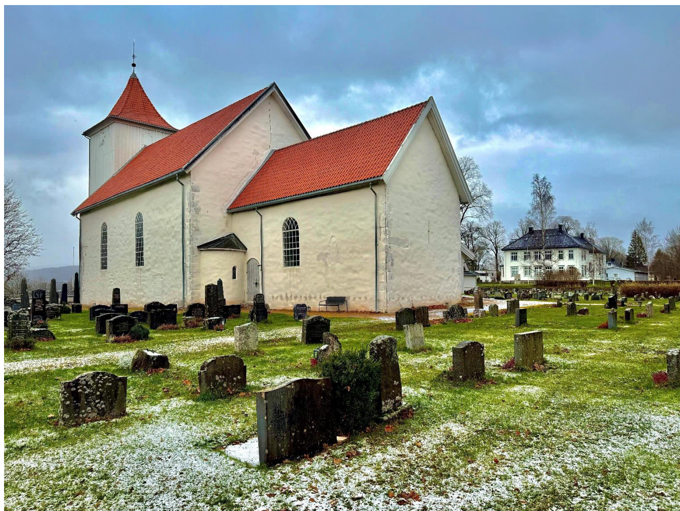
Sande Kirke