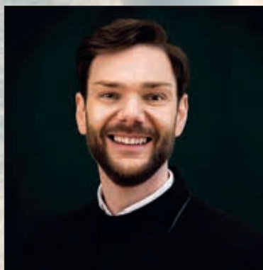
Ny leder av Botne Menighetsråd s. 5